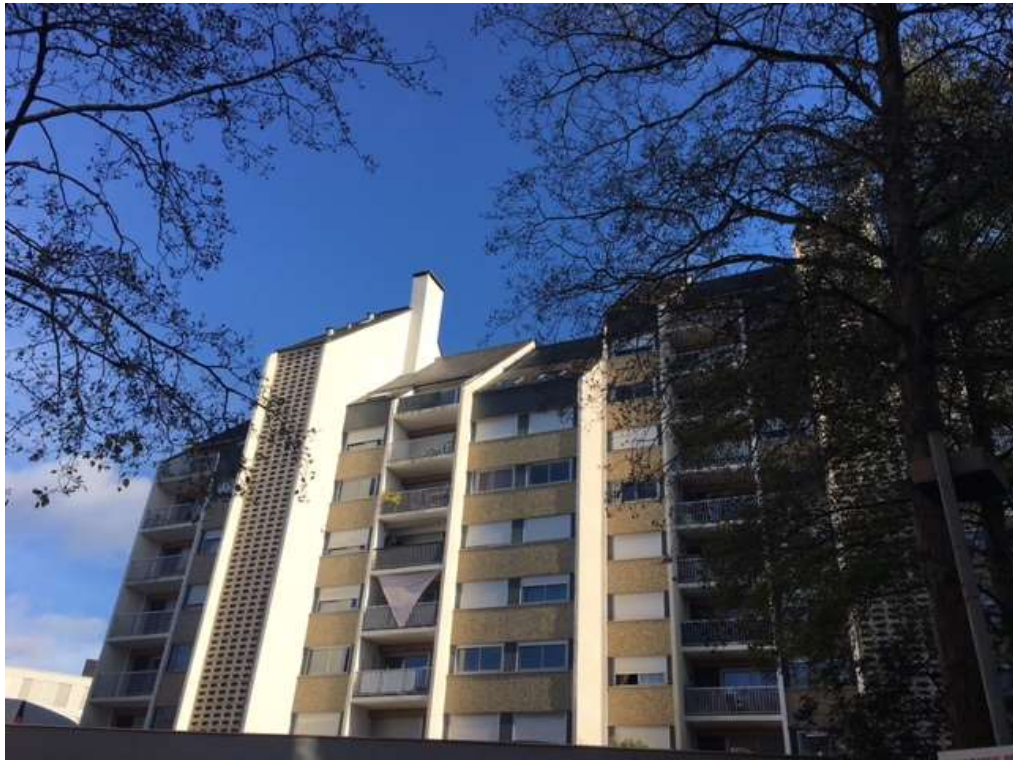
Figure 6 : Visuel des appartements de l'immeuble de la rue de Dinan