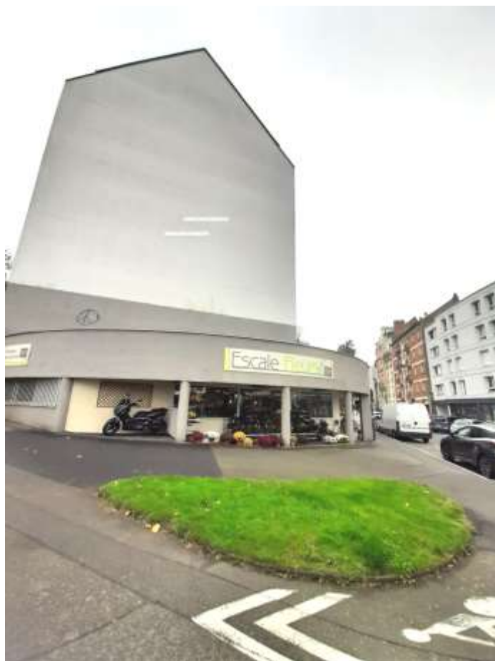
Figure 1 : Pignon de mur à peindre. La nacelle sera positionnée sur le carré de la pelouse