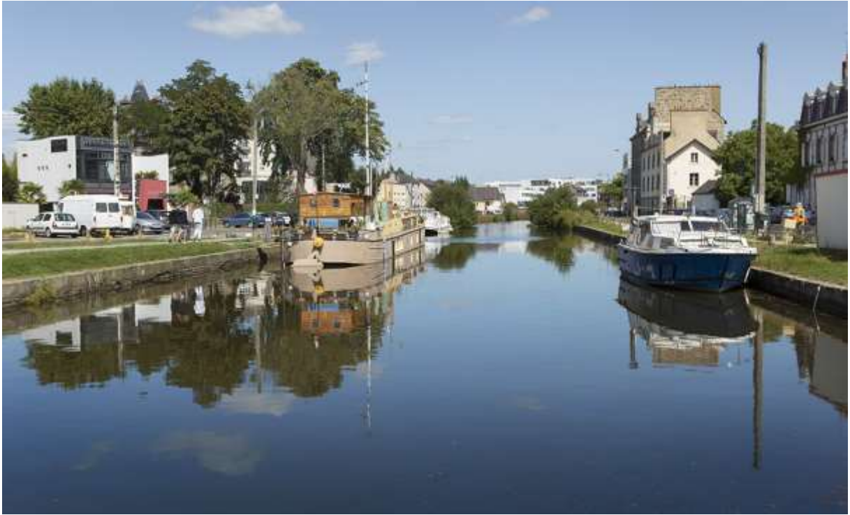
Figure 9 : En toute proximité de l'immeuble, le canal avec des péniches amarrées