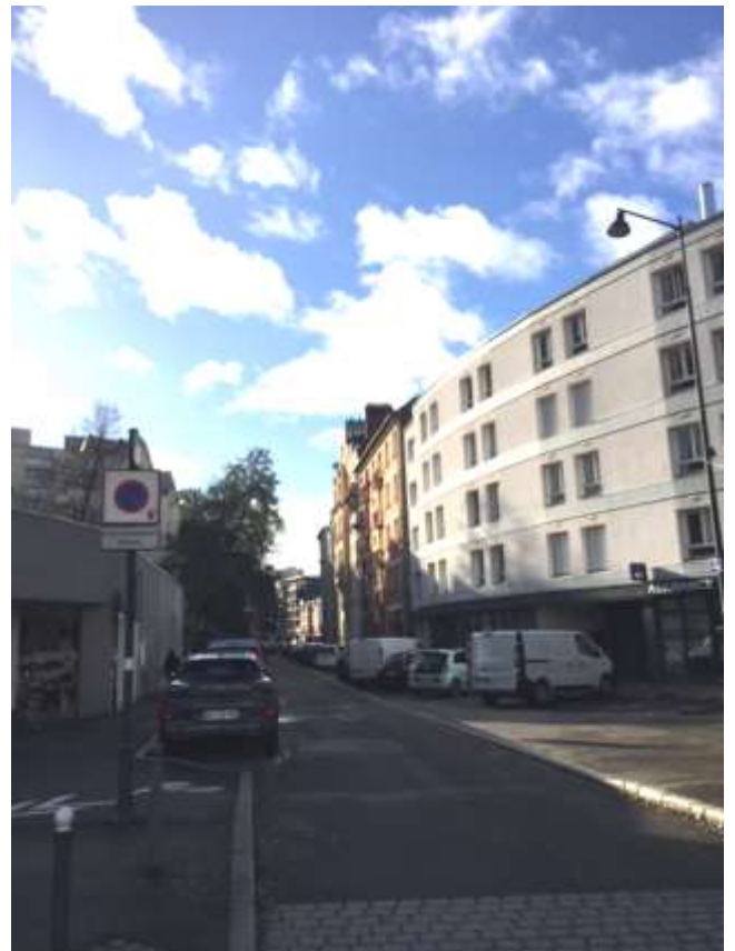
Figure 8 : Vue de la rue de Dinan