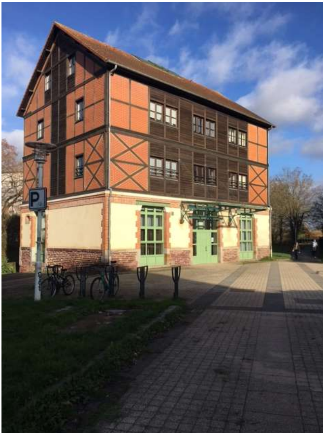
Figure 10 : Face à l'immeuble en lisière du canal, ancienne Tannerie reconvertie en logements