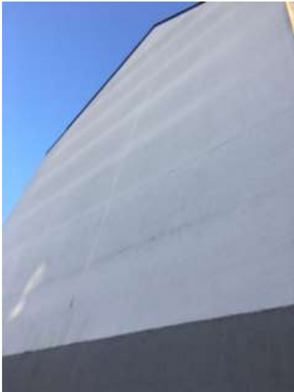
Figure 2 : Vue proche du pignon à peindre