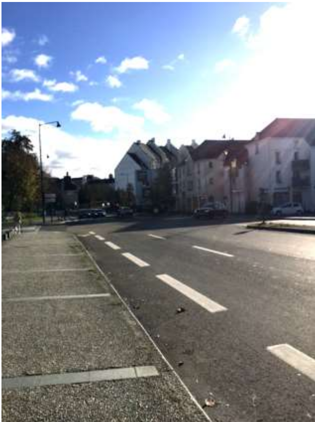
Figure 7 : Vue de la rue de Saint-Malo (entrée/sortie de la ville)