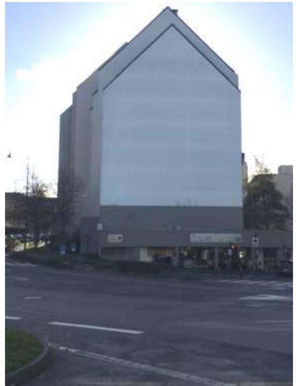
Figure 3 : Vue du pignon de la rue en face