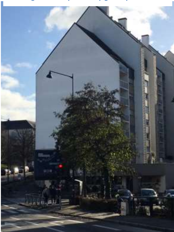
Figure 4 : Vue d'angle donnant rue de Dinan