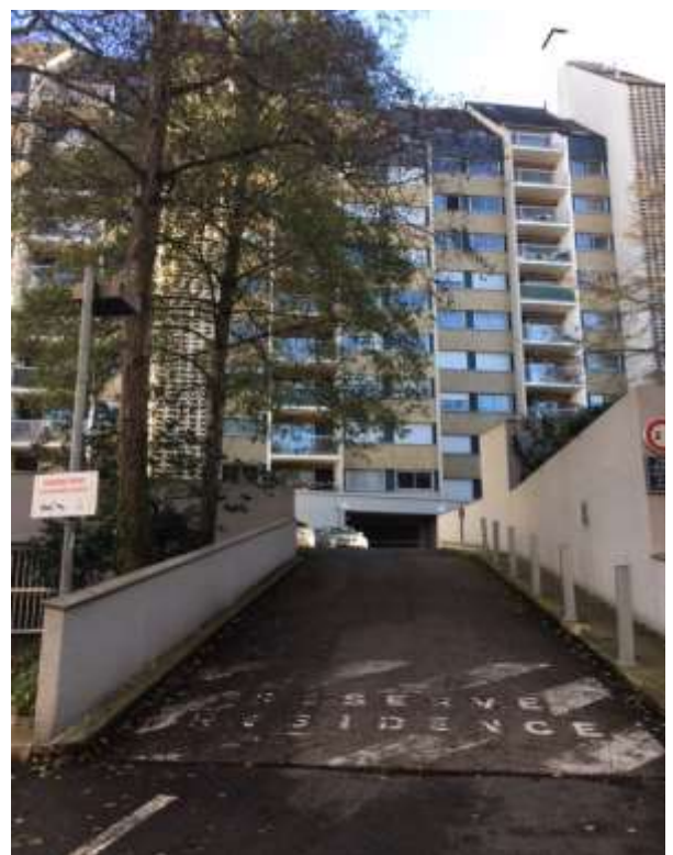
Figure 5 : Vue de l'entrée de l'immeuble donnant rue de Dinan